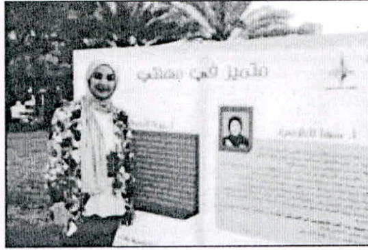
«متميز في مهنتي... أحد شعارات اليوم الخليجي»

الى تعريف الجمهور ببرامجها، والحوافز التي تقدمها لطلبتها، ومنها مكافأة التخصص النادر الشهرية التي تبلغ 350 ديناراً، إضافة الى المجالات التي يمكن ان يعمل فيها خريجو الكلية. وقال إن الكلية اختارت ان تكون احتفالياتها هذا العام في يوم العطلة الأسبوعية وفي مكان عام لتكون مناسبة يشارك فيها اكبر عدد من الجمهور، مشيراً الى ان الفعالية تضمنت أنشطة متنوعة منها ماراثون للشمسي، إضافة الى تقديم بعض الخدمات التمريضية، مثل قياس مستوى السكر والضغط، والإجابة عن الاستفسارات الخاصة بمهنة التمريض.