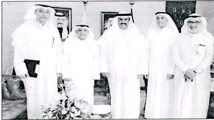
• المصنف متوسطا الرفاعي والبحر والعمشان والمصالح

لتكون أكثر شمولية وادق تفصيلا. لجعل دلمل العمل الإداري في الهيئة يعمل ضمن معايير واضحة. وهو ما ستترتب عليه جودة العمل الأكاديمي. وأهمها لوائح الترفيات والتعيينات والبعثات